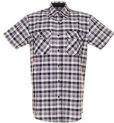
schwarz kariert 0486