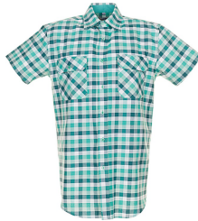
grün kariert 0487