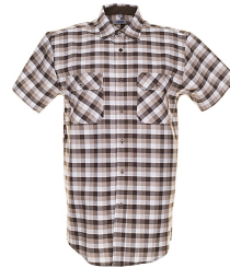
stone kariert 0488