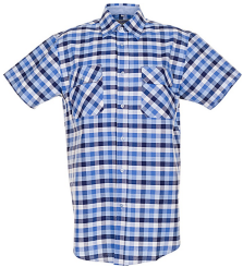
blau kariert 0485