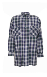
grün kariert 0452