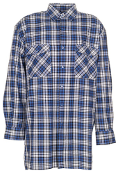
blau kariert 0450