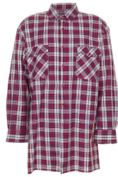
rot kariert 0451